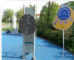
Seniorenzeit für betreutes Wohnen

Wie soll Ihr persönlicher Wohnraum im Alter aussehen?